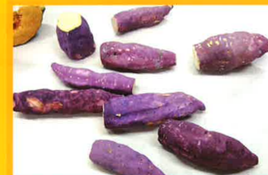
キミ子方式でカボチャ・サツマイモをつくろう!(塑像入門)作品一例

愛知教育大学では、教育大学の特性を活かし「教育をテーマとした一般向けの講座」「学校の先生向けの実践的な講座」「子ども向けの講座」「免許状取得のための免許法認定講座」など、バラエティー豊かな講座を用意して皆さんの参加をお待ちしています。