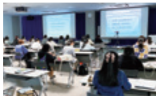
ガイダンスの様子

年間を通して、就職支援業界や、官公庁・企業の人事の方々を講師にお呼びし、就活の始め方から実践的なワークまで、数多くのガイダンス・イベントを開催しています。