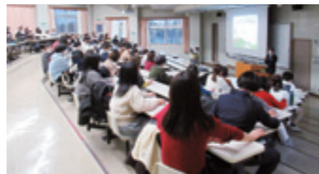
教員採用試験説明会