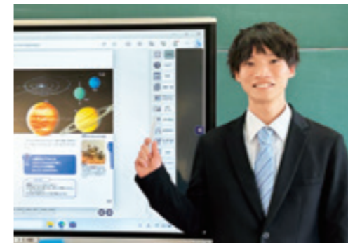
愛知県公立中学校 勤務