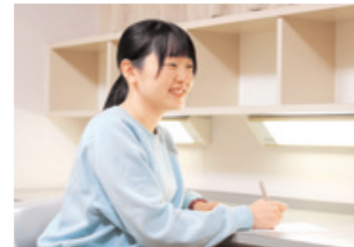
愛知県庁 福祉局 愛知学園 勤務

在学中は学業に加え、ボランティアやアルバイト、部活動などさまざまなことに取り組むようにしていました。そのときの経験は今、仕事においても支えになっています。好奇心を爆発させて、大学でしかできないことや興味があることをたくさん体験してみてください。