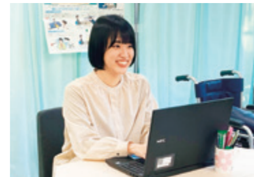
愛知県立津島高等学校 勤務

自由に使える時間をどう過ごすかで、社会に出てから大きな差になると思います。勉強することはもちろん、旅行や遊びに行き、見聞を広めることも心掛けてください。