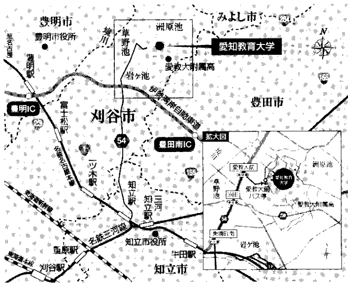
知立駅からの名鉄バスルート