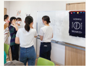
地域支援活動を企画・実施