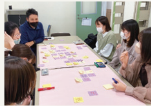
企業の代表を交えて地域課題の検討

3年次には、学生は自分の関心に沿ってゼミを選択し、卒業論文の作成に取り組みます。障害福祉ゼミでは、地域支援活動に取り組む企業の協力を得て、支援活動に積極的に取り組んでいます。