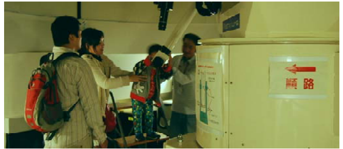
前回（第 96 回）の観望会の様子。