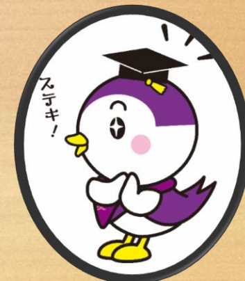
カキツバタ色のツバメ「愛教ちゃん」

場 所: 教育交流館1階 (Educational Communication Building 1F) 利用時間(Open): 8:30~17:00